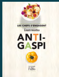
Vaincre le gaspillage RESTAURATION

ÉGALEMENT SUR LE THÈME DES BONNES PRATIQUES :