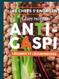
Recettes anti-gaspi LÉGUMES ET LÉGUMINEUSES