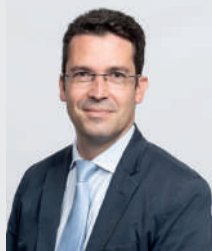
Pierre Bolze Conseiller départemental du canton de Beaune