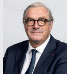
François Sauvadet Membre du Bureau Ancien Ministre Président du Conseil départemental