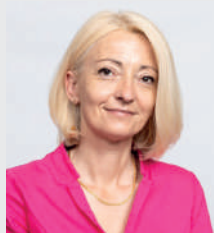
Laurence Porte Conseillère départementale du canton de Montbard